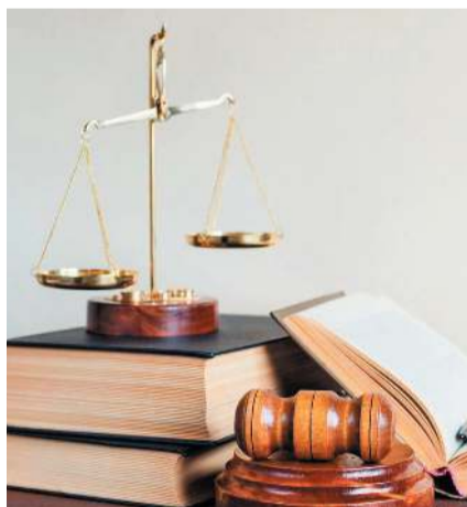
ГРАФИК ВЫЕЗДНЫХ КОНСУЛЬТАЦИЙ НА ФЕВРАЛЬ 2024 ГОДА

Члены Профсоюза АСМ РФ вправе обращаться за юридической помощью в любой пункт выездных консультаций, независимо от структурного подразделения Первичной профсоюзной организации АО «АВТОВАЗ» АСМ РФ, в котором они состоят на учёте.